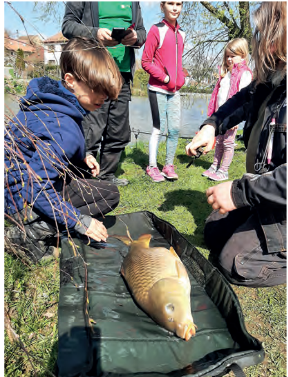
Jarní rybářské závody