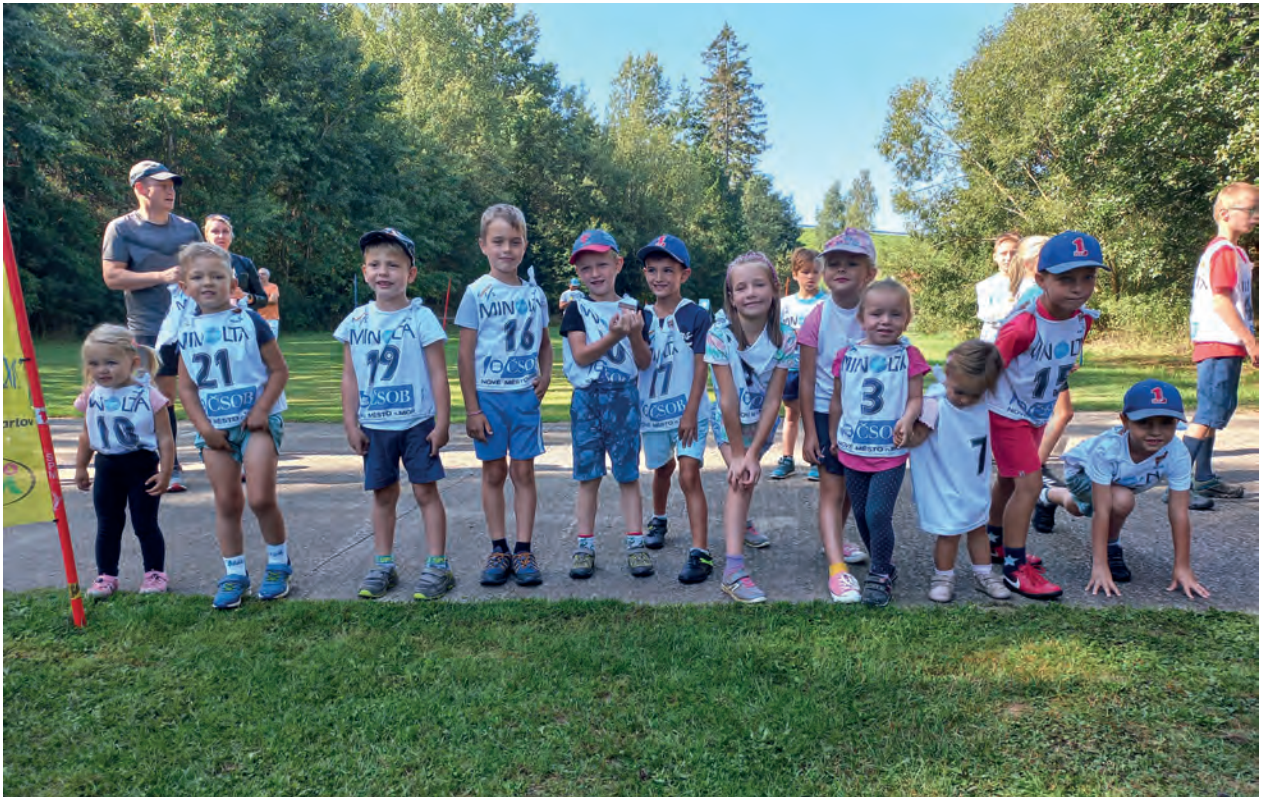
31. ročník běhu Matyáše Žďárského