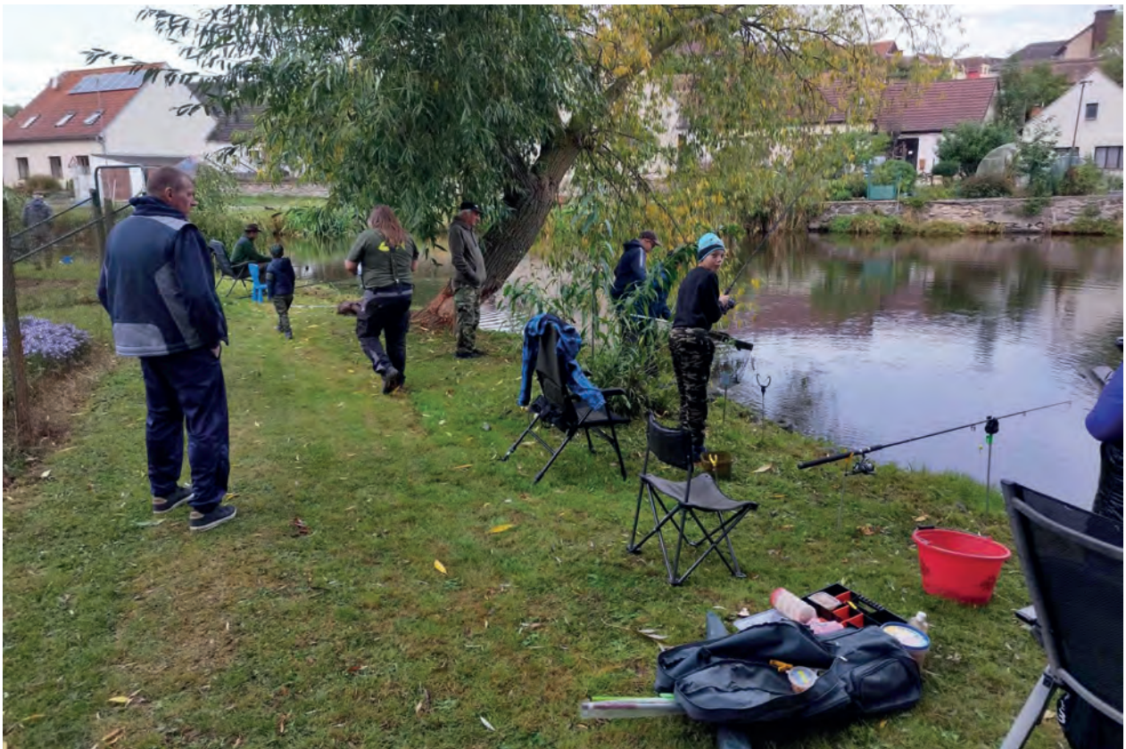
Podzimní rybářské závody