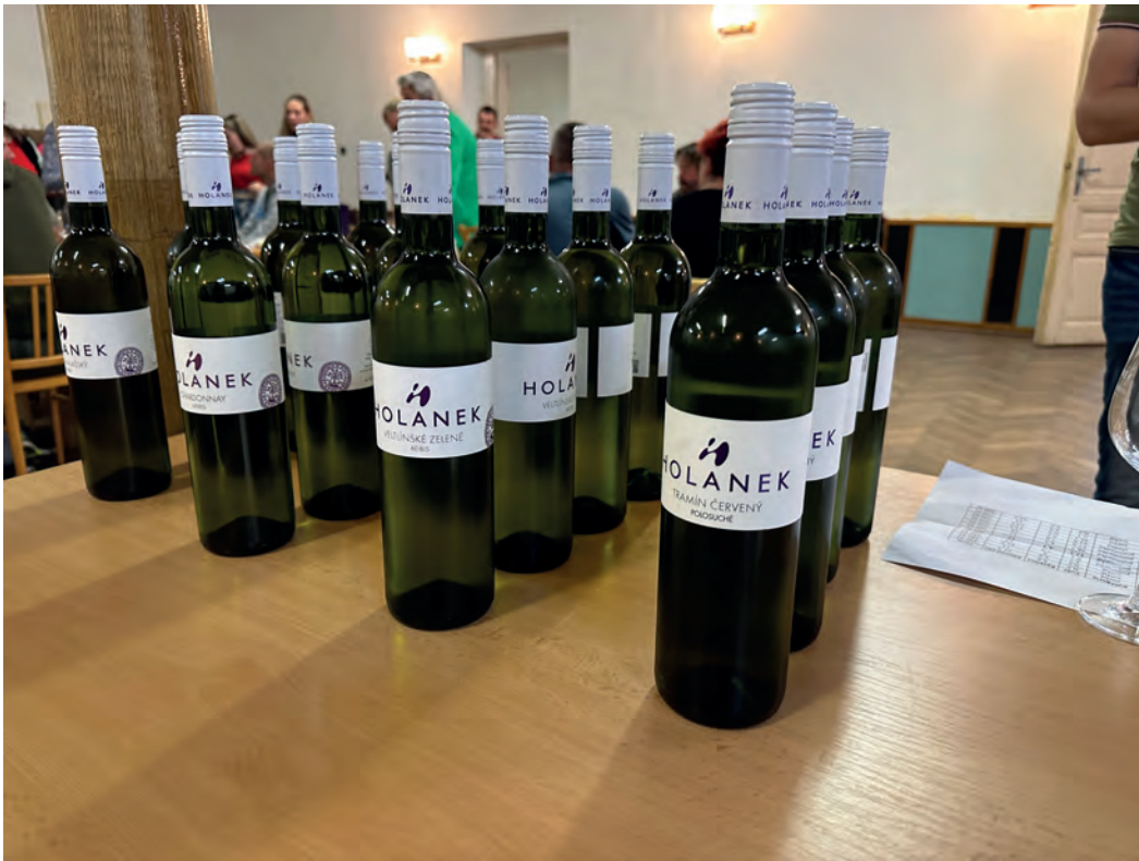
Degustace vín Holánek