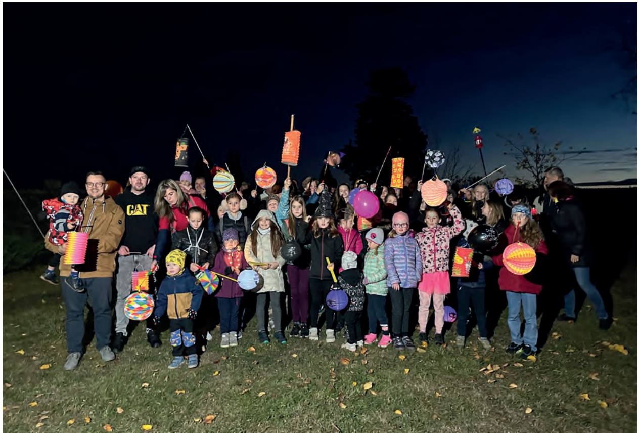
Lampionový průvod k výročí 28. října