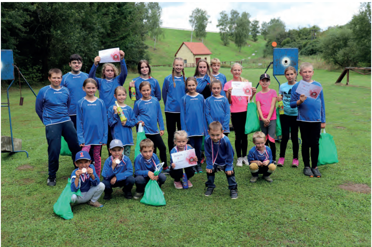
Soutěž mladých hasičů