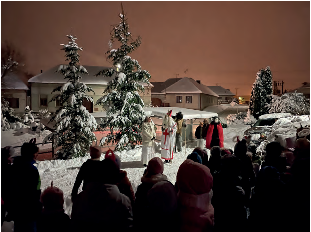
Rozsvícení stromu a Mikulášská nadílka