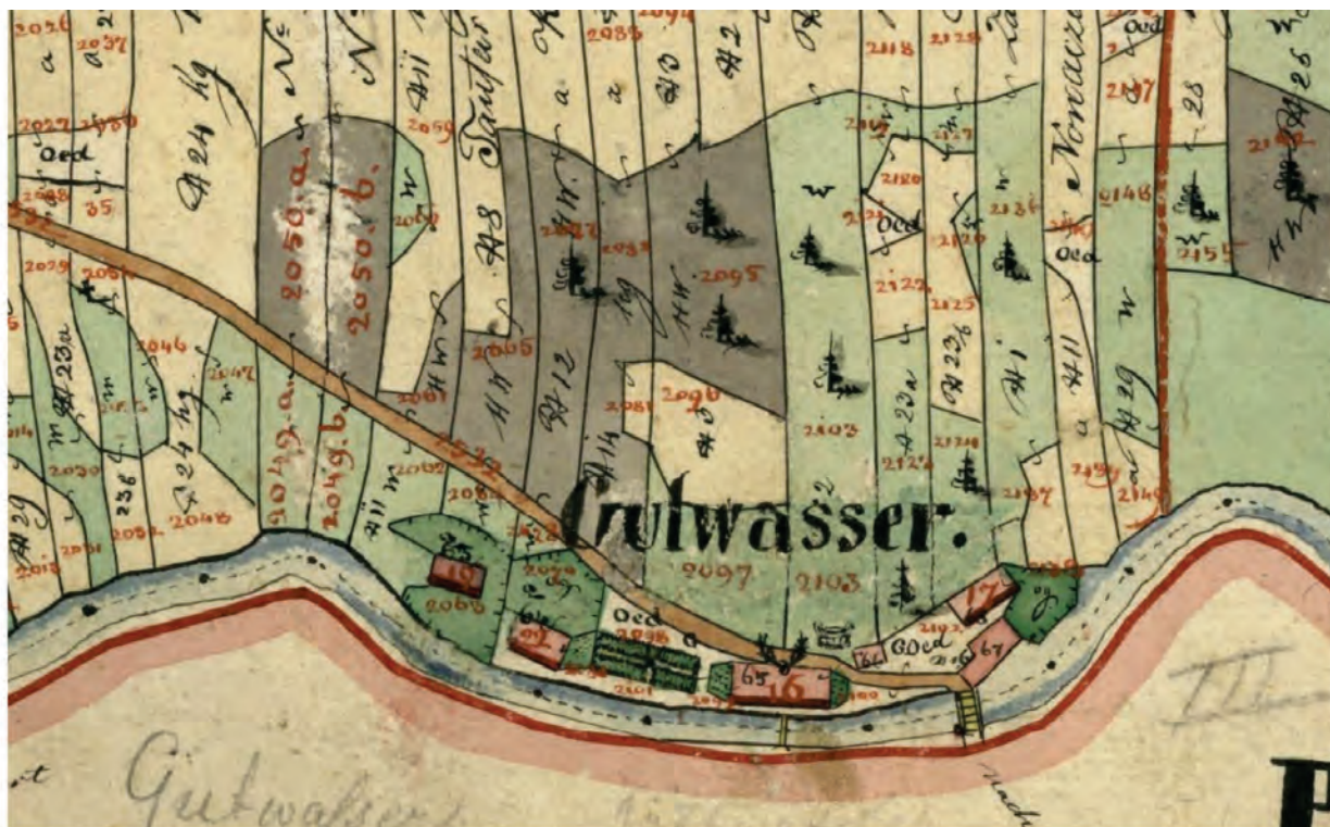
Mapa Dobré Vody (Kozichovická část) z roku 1835 – Císařské povinné otisky stabilního katastru