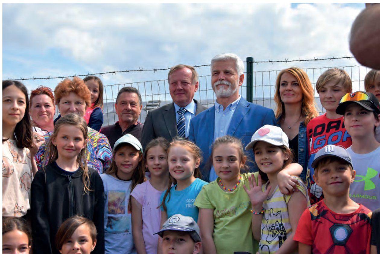
Návštěva prezidenta republiky