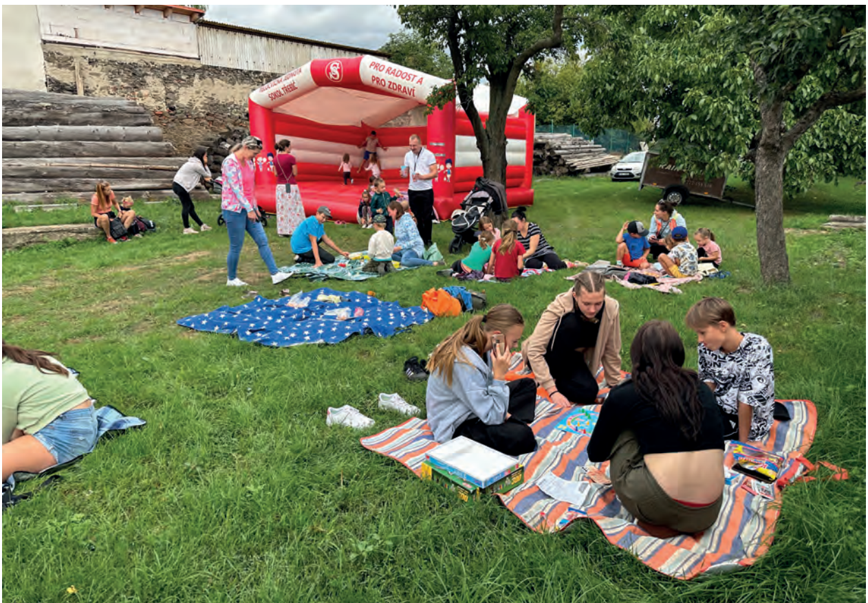
Odpoledne deskových her