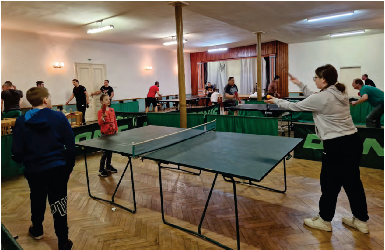
Turnaj ve stolním tenisu