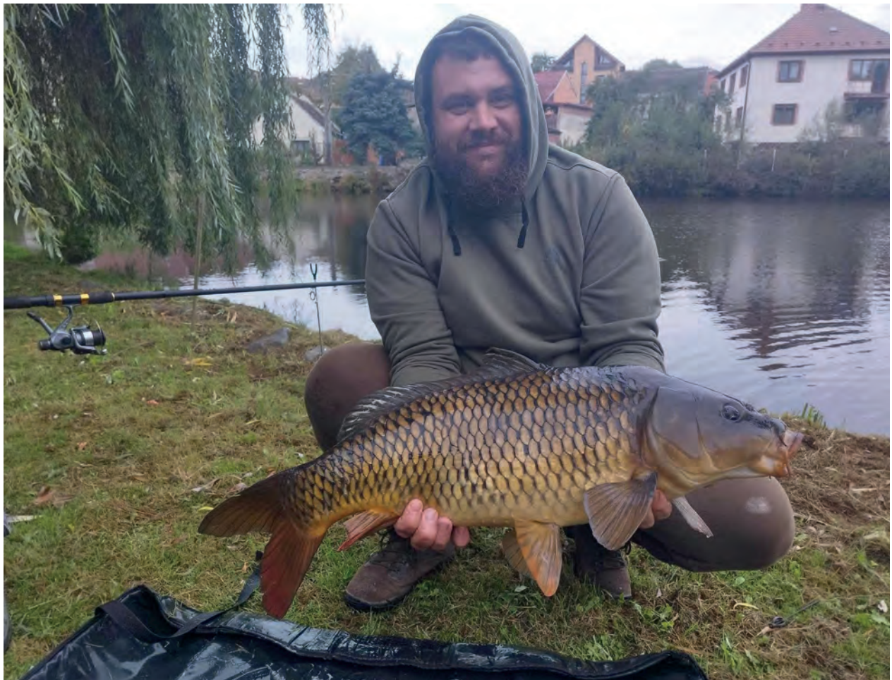
Podzimní rybářské závody